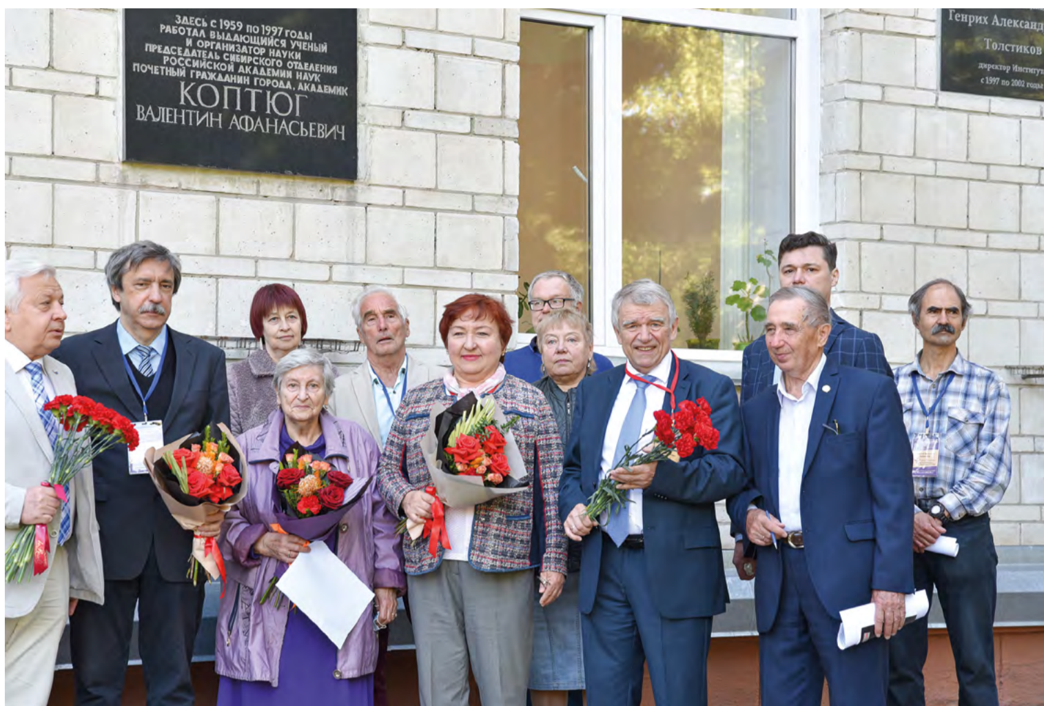
Возложение цветов к мемориальной доске В. А. Коптюга

«Для меня большая честь сегодня присутствовать на мероприятии, приуроченном ко дню рождения великого по меркам не только Сибирского региона, но также России и мира человека — академика В. А. Коптюга. Лично для меня Валентин Афанасьевич прежде всего ученый — химик-органик, который активно преобразовывал методическую основу исследований: подключал физические методы, а также информатику (в институте даже был построен новый корпус специально для занятий математическими методами в химии). Важнейшая сфера его интересов — устойчивое развитие: на рубеже 1990-х годов страна рушилась,