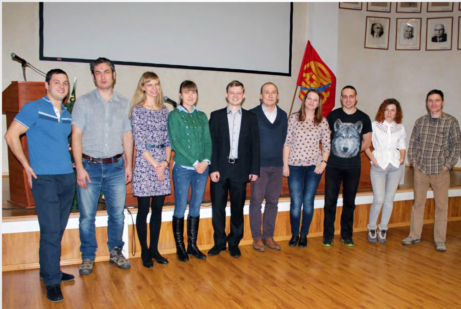
Состав СММ на 2017-2019 гг.